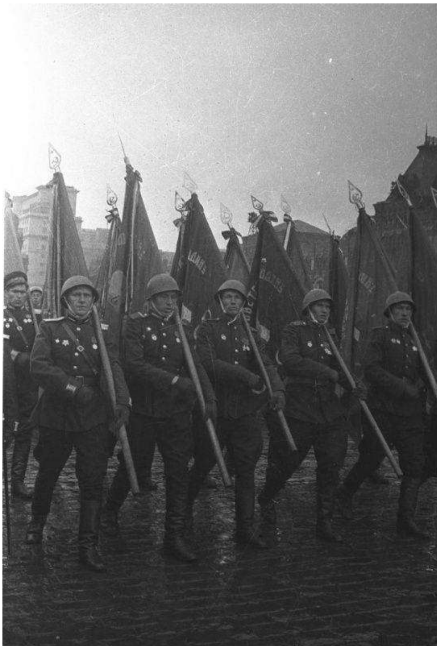
Парад Победы. Строй моряков