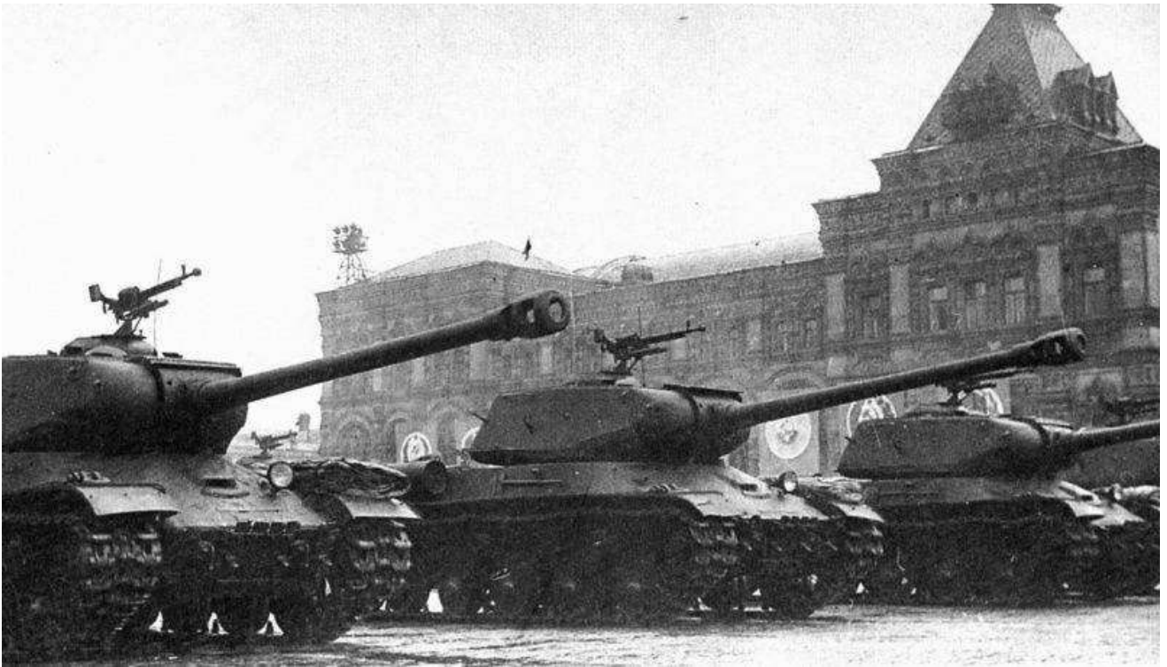
Тяжелые танки ИС-2 проходят по Красной площади во время парада в честь Победы 24 июня 1945 года