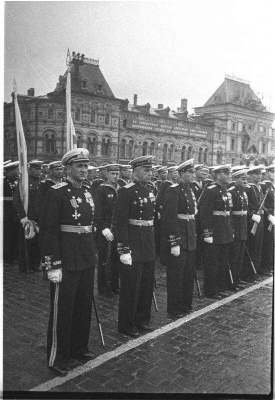
Парад Победы. Строй офицеров-танкистов