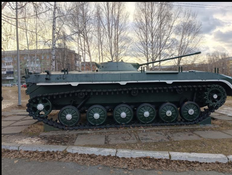
Боевая машина пехоты: мобильность и поддержка огнём

В экспозиции представлена советская гусеничная боевая машина пехоты. Это первая в мире серийная плавающая БМП, предназначенная для перевозки личного состава к месту выполнения задачи. Машина усиливала мобильность, защиту и огневую поддержку совместно с танками.