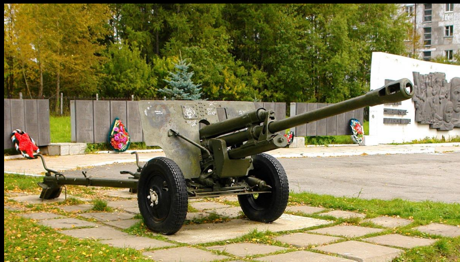
Пушка ЗИС-3: символ огневой силы

В экспозиции представлена советская гусеничная боевая машина пехоты. Это первая в мире серийная плавающая БМП, предназначенная для перевозки личного состава к месту выполнения задачи. Машина усиливала мобильность, защиту и огневую поддержку совместно с танками.